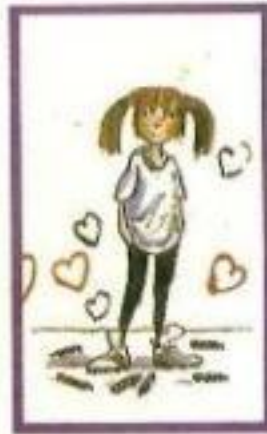
ilustración de cubierta: TONY ROSS